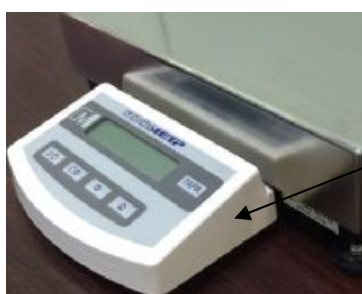
Место нанесения знака поверки в виде наклейки