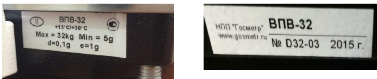
Рисунок 3 - Маркировка весов